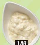
149 自家製エッグタルタル