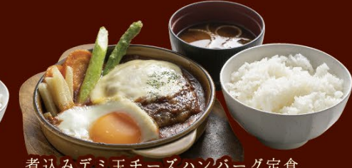
045 煮込みデミ玉チーズハンバーグ定食 定食(ご飯・赤だし付) 880円