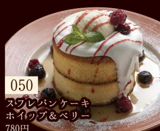
050 スフレパンケーキ ホイップ&ベリー 780円