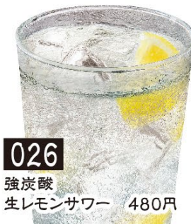
026 強炭酸生レモンサワー 480円