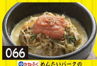
066 かねふくめんたいパークの 石焼明太子チーズビビンバ