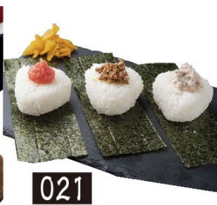
021 コシカリのおにぎりセット(明太子・ピリ辛ミンチ・ツナ) 480円