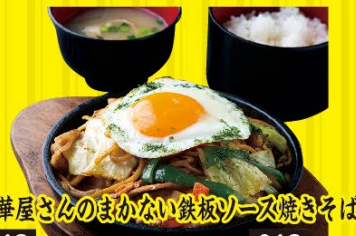
中華屋さんのまかない鉄板ソーメン焼きそば