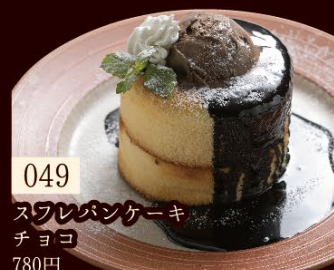
049 スフレパンケーキ チョコ 780円