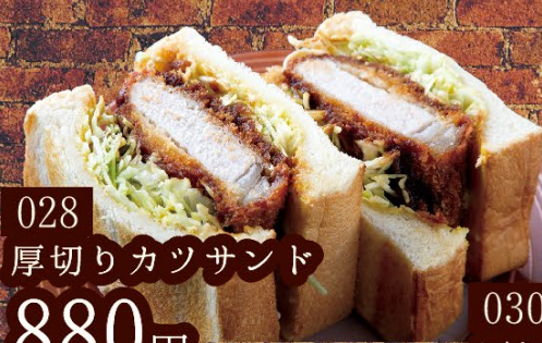
028 厚切りカツサンド 880円