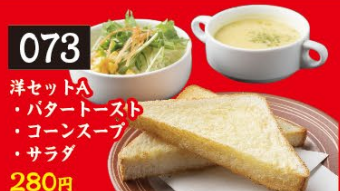
073 洋セットA ・ポテトトースト ・コーンスープ ・サラダ