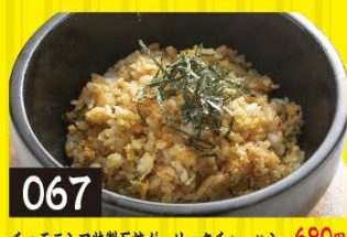
067 チョモランマ特製石焼ガーリックチャーハン