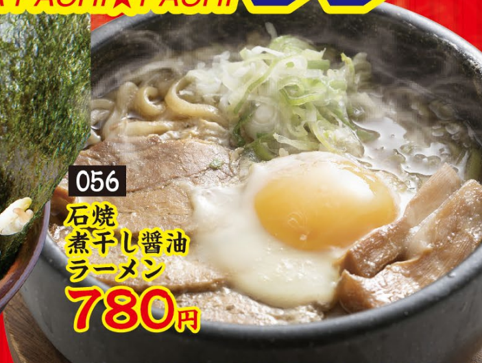
056 石焼 煮干し醤油 ラーメン