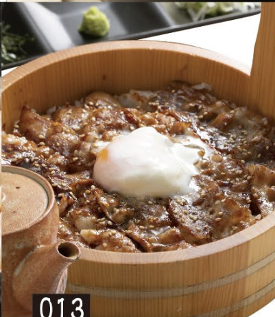
013 炙り焼き豚の桶まぶし 880円