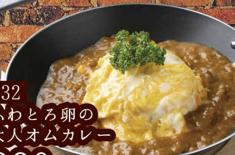
032 ふわとろ卵の 大人オムカレー 880円