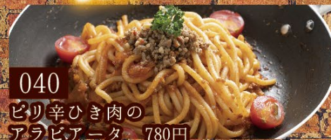
040 ピリ辛ひき肉の アラビアータ 780円