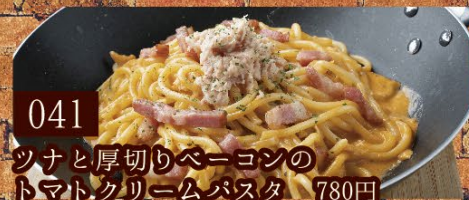
041 ツナと厚切りベーコンの トマトクリームパスタ 780円