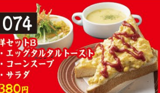
074 洋セットB ・エッグタルタルトースト ・コーンスープ ・サラダ