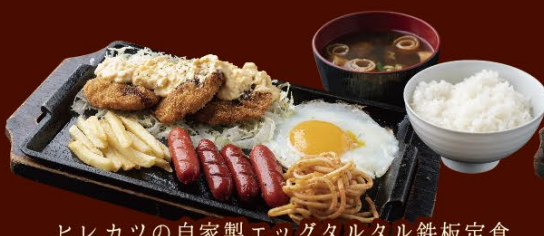
043 ヒレカツの自家製エッグタルタル鉄板定食 定食(ご飯・赤だし付) 980円