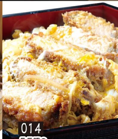
014 三元豚の肉厚ロースカツ重 880円