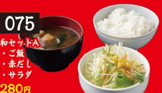
075 和セットA ・ご飯 ・赤だし ・サラダ