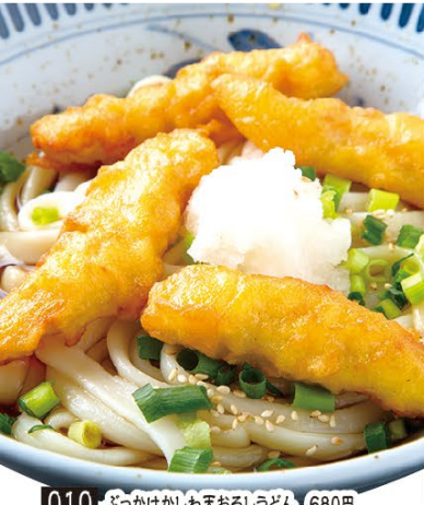
010 ぶっかけがしわ天おろしうどん 680円 011 ぶっかけがしわ天おろしうどんダブル(2玉) 880円