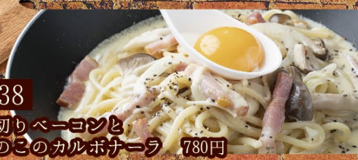
038 厚切りベーコンと きのこのカルボナーラ 780円