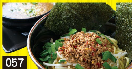
057 つけ麺レッド台湾