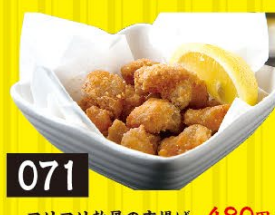
071 コリコリ軟骨の唐揚げ