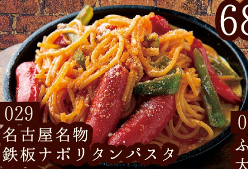
029 名古屋名物 鉄板ナポリタン Pasta 780円