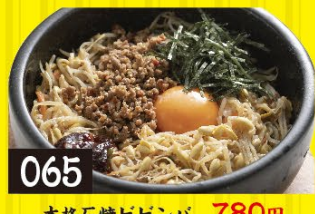
065 本格石焼ビビンバ