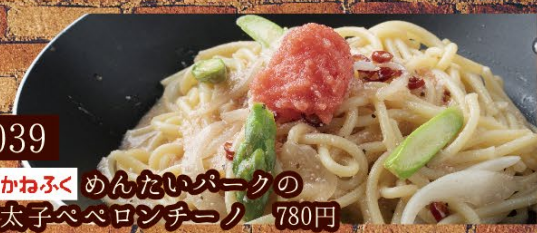
039 かねふくめんたいパークの 明太子ペペロンチーノ 780円