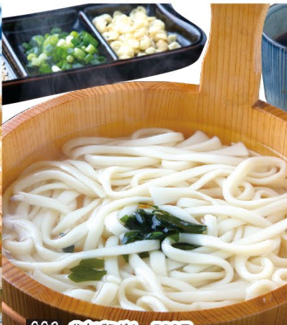
003 釜あげうどん 580円 004 釜あげうどんダブル(2玉) 880円