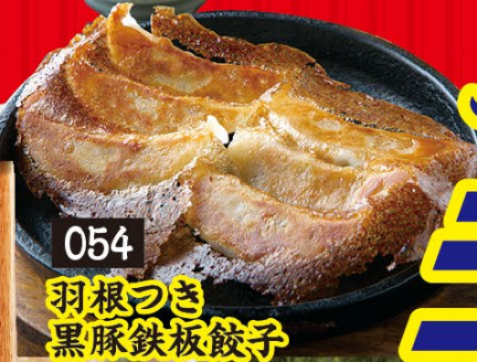
054 羽根つき 黒豚鉄板餃子