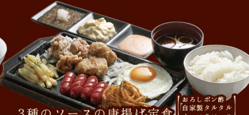
044 3種のソースの唐揚げ定食 おろしポン酢 自家製タルタル オーロラソース 定食(ご飯・赤だし付) 880円