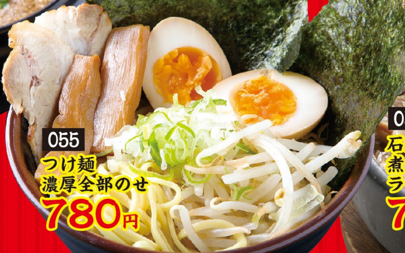
055 つけ麺 濃厚全部のせ