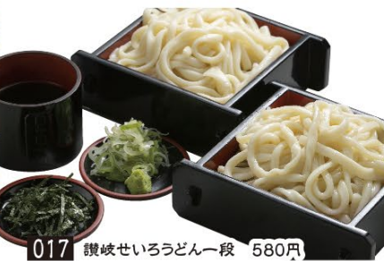
017 讃岐せいろうどん一段 580円 018 讃岐せいろうどん二段 880円