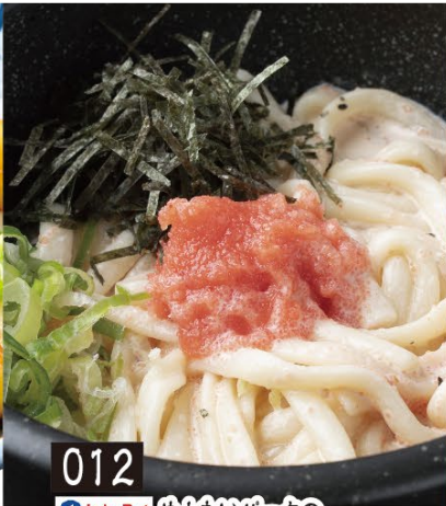
012 かねふくめんたいパークの石焼明太子クリームうどん 780円