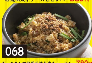
068 チョモランマ特製石焼台湾チャーハン