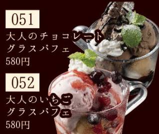
051 大人のチョコレート グラスパフェ 580円