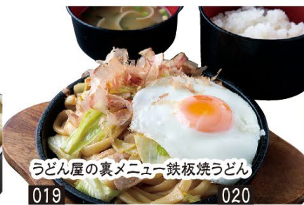
うどん屋の裏メニュー鉄板焼うどん 019 定食(ご飯・赤だし付) 780円 020 単品 680円