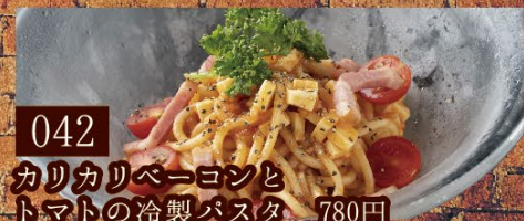
042 カリカリベーコンと トマトの冷製パスタ 780円