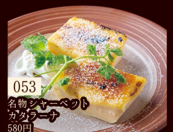
053 名物しゃぶべつ カグラナ 580円