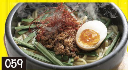
059 石焼極み塩台湾ラーメン