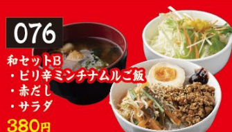
076 和セットB ・ピリ辛ミンチナムルご飯 ・赤だし ・サラダ