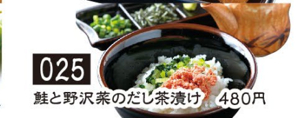
025 鮭と野沢菜のだし茶漬け 480円