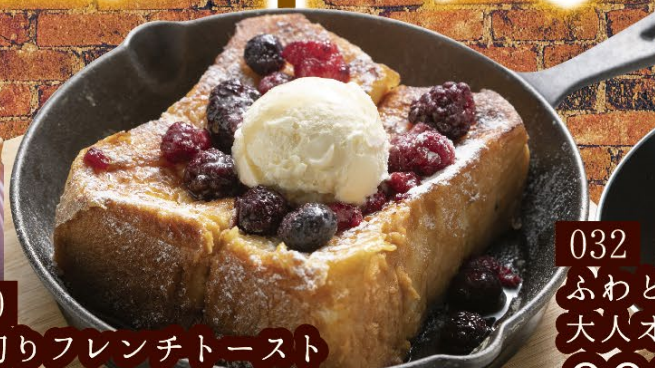
030 厚切りフレンチトースト 680円