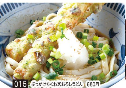
015 ぶっかけちくわ天おろしうどん 680円 016 ぶっかけちくわ天おろしうどんダブル(2玉) 880円