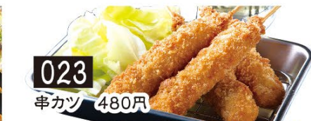
023 串カツ 480円