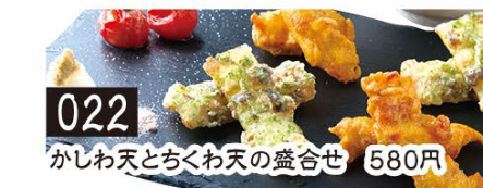
022 がしわ天とちくわ天の盛り合せ 580円