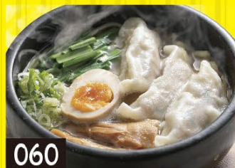
060 石焼極み塩ワンタンラーメン