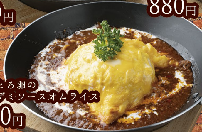
031 ふわとろ卵の 大人デミソースオムライス 880円