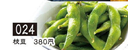
024 枝豆 380円