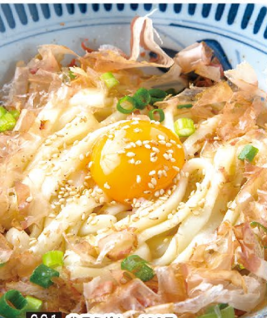
001 釜玉うどん 480円 002 釜玉うどんダブル(2玉) 780円