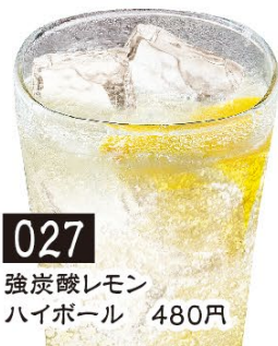
027 強炭酸レモンハイボール 480円