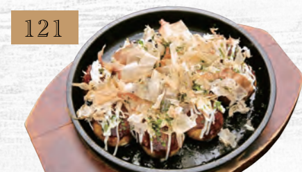
121 鉄板たこ焼き 580円