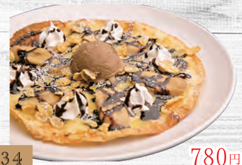
134 大人チョコレートドルチェピザ 780円