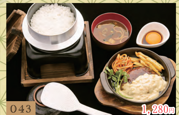
043 1,280円 タルタル照焼きハンバーグの釜戸ご飯定食