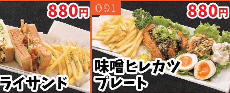
089 自家製タルタルの 海老フライプレート 880円