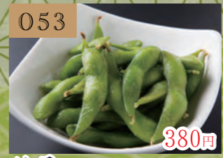
053 380円 枝豆