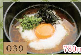
039 780円 月見とろろ蕎麦【温】