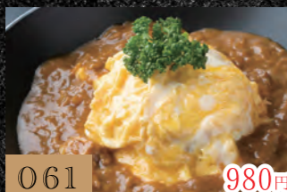
061 ふわとろ卵のオムカレー 980円