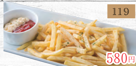
119 山盛りフライドポテト 580円