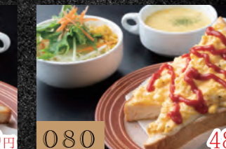
080 Dセット (エッグタルタルトースト・スープ・サラダ) 480円