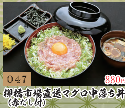
047 880円 柳橋市場直送マグロ中落ち丼 (赤だし付)