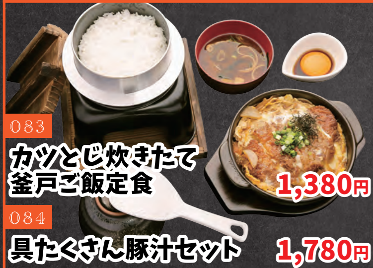
083 カツとび炊きたて 釜戸ご飯定食 1,380円