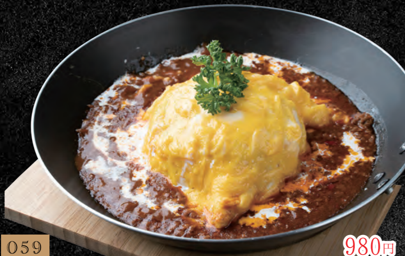
059 ふわとろ卵の大人デミソースオムライス 980円