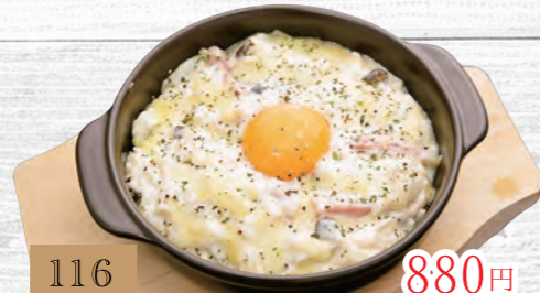
116 ベーコンとシーフードのカルボナーラリゾット 880円