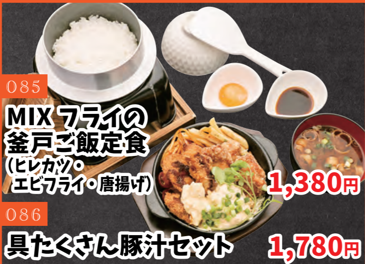
085 MIXフライの 釜戸ご飯定食 (ヒレカツ・ エビフライ・唐揚げ) 1,380円