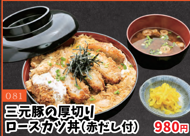
081 三元豚の厚切り ロースカツ丼(赤だし付) 980円