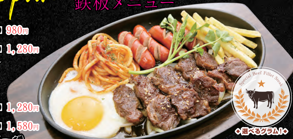
鉄板特製牛ヒレステーキ (シングル150g) 067 【単品】1,280円 068 【定食】1,580円 鉄板特製牛ヒレステーキ (ダブル300g) 069 【単品】1,680円 070 【定食】1,980円