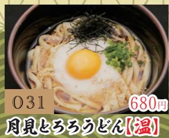
031 680円 月見とろろうどん【温】