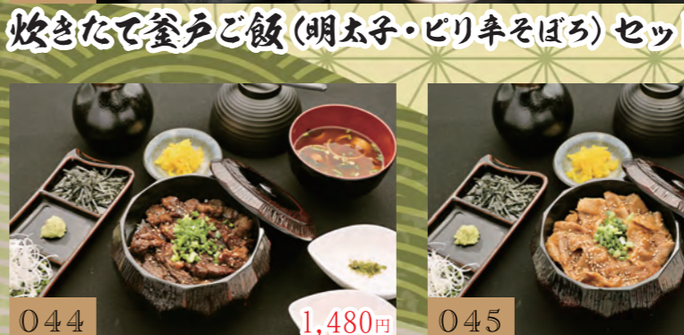
044 1,480円 炊きたて釜戸ご飯(明太子・ピリ辛そばろ) セット 特製牛ヒレステーキのひつまぶし