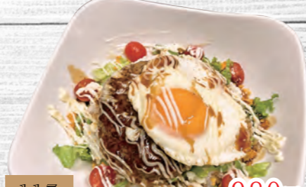
117 ハワイアンロコモコ丼 980円