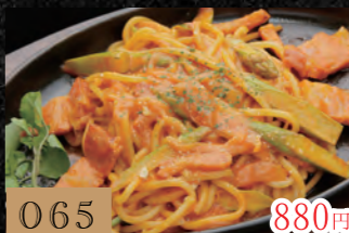
065 アスパラとベーコンのトマトクリームパスタ 880円