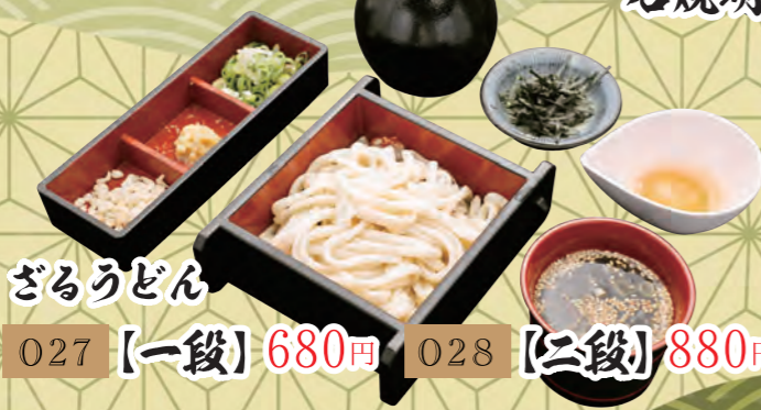
ざるうどん 027 【一段】680円 028 【二段】880円