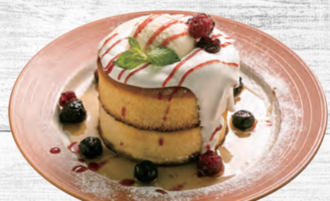
131 ベリースフレパンケーキ 680円