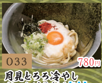
033 780円 月見とろろ冷やし ぶっかけうどん【冷】