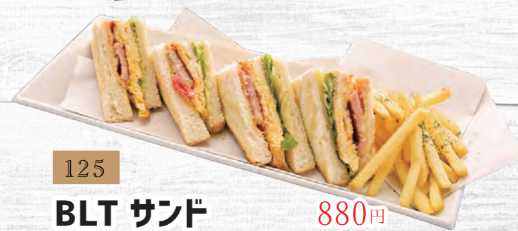
125 BLT サンド 880円