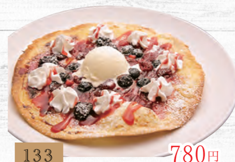
133 ベリーのドルチェピザ 780円