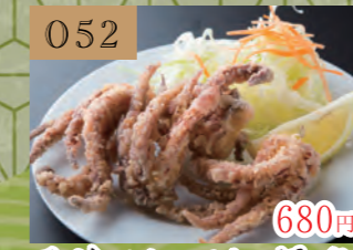
052 680円 三陸イカのゲソ揚げ