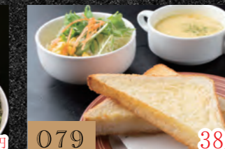
079 Cセット 380円 (トースト・スープ・サラダ)