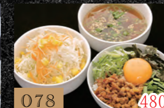
078 Bセット 480円 (ミニ台湾丼・中華スープ・サラダ)