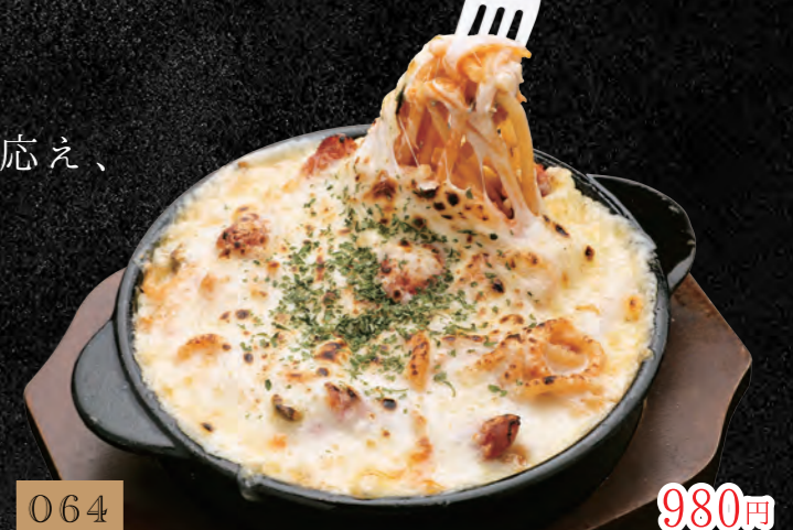
064 釜焼きスタミナチーズナポリタン 980円