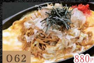
062 鉄板やぎそば 880円