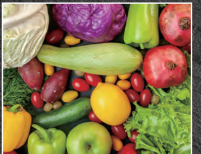
092 ベースサラダ 530円