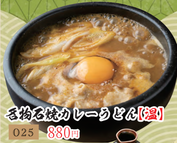
香物石焼カレーうどん【温】 025 880円