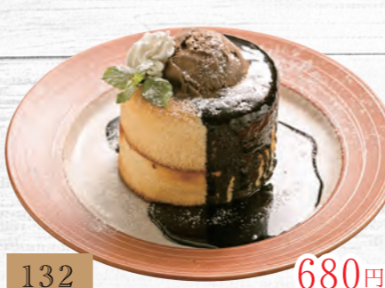
132 チョコスフレパンケーキ 680円