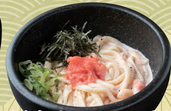
石焼明太子クリームうどん【温】 026 780円