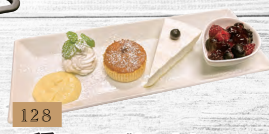
128 2種のチーズケーキとベリーの盛り合せプレート (バスクチーズ&レアチーズ) 880円