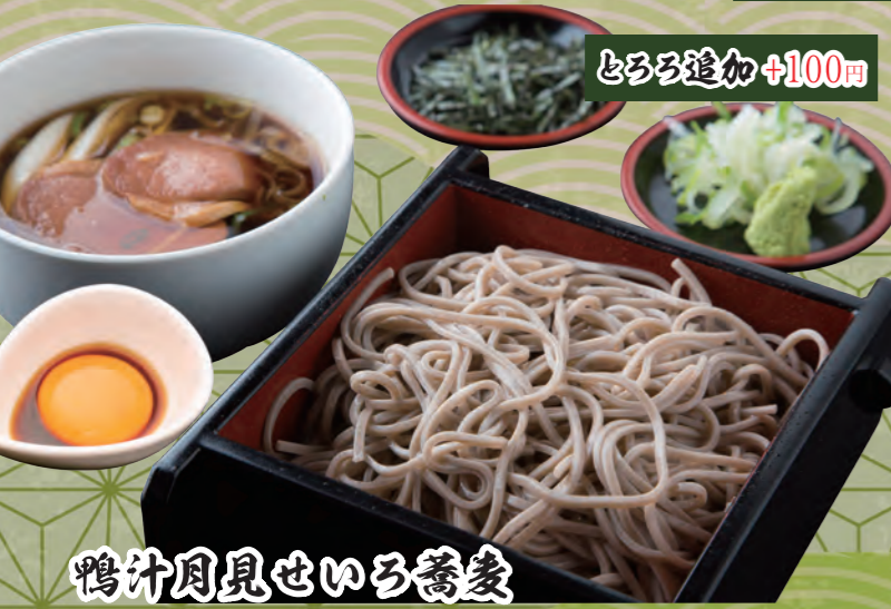
鴨汁月見せいろ蕎麦 034 【一段】980円 035 【二段】1,180円