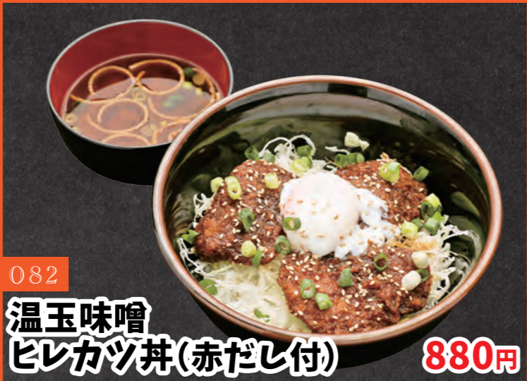
082 温玉味噌 ヒレカツ丼(赤だし付) 880円