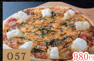
057 明太マヨもちチーズ 980円