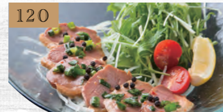
120 鴨のローストマリネ 680円