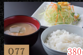
077 Aセット 380円 (ご飯・赤だし・サラダ)