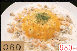
060 海の幸たっぷり明太クリームオムライス 980円