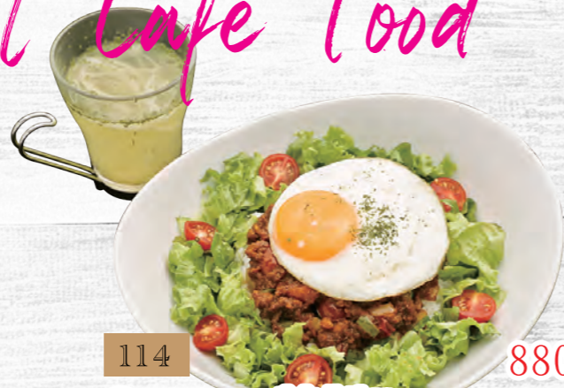
114 ⑧CAFE 特製ドライカレー 880円