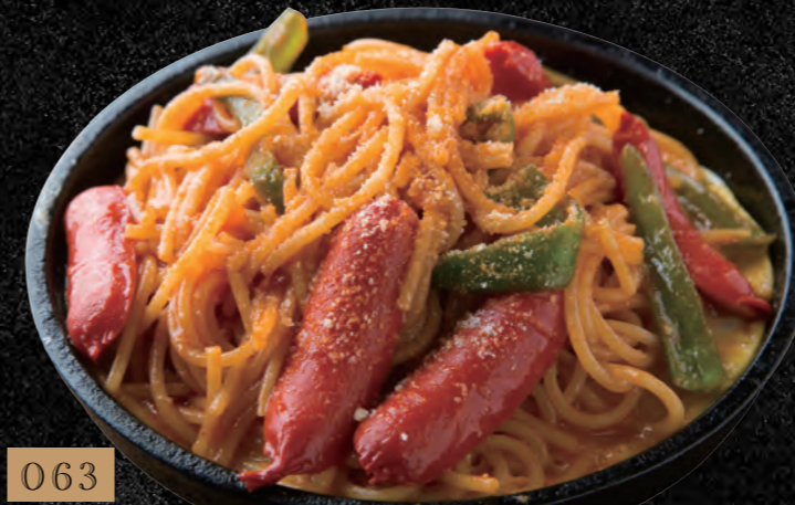
063 名古屋名物鉄板ナポリタン 880円