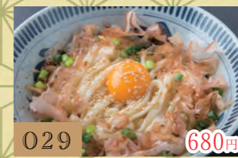
029 釜玉うどん【温】 680円