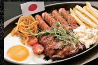
071 【単品】980円 072 【定食】1,280円 炙り照り焼きタルタルチキングリル