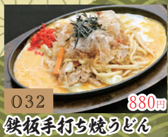
032 880円 鉄板手打ち焼うどん