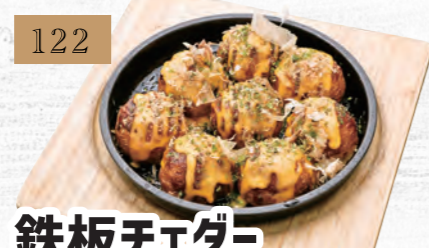
122 鉄板チーズたこ焼き 680円