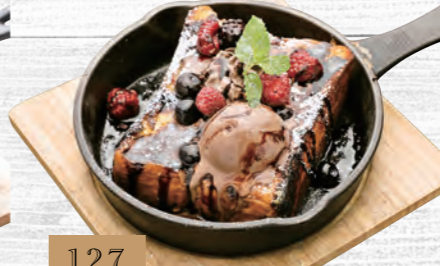
127 ベルギーチョコのフレンチトースト 780円