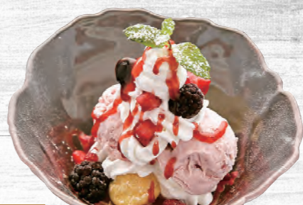
129 イチゴパフェ丼 680円