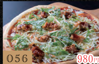
056 照り焼きチキン 980円