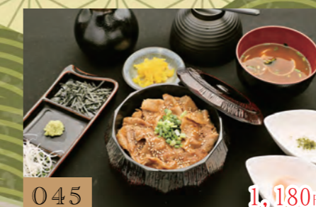
045 1,180円 炙り焼き豚のひつまぶし