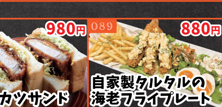
088 厚切りカツサンド 980円