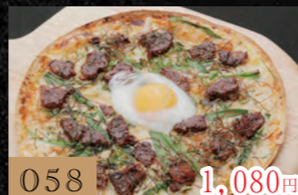
058 甘辛温玉プルコギ 1,080円