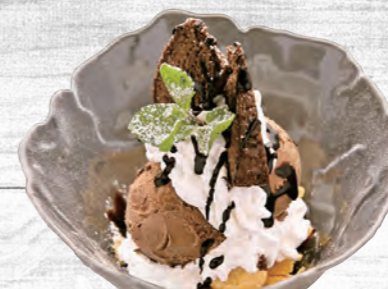
130 大人のチョコパフェ丼 680円