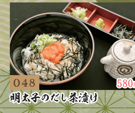
048 580円 明太子のだし茶漬け