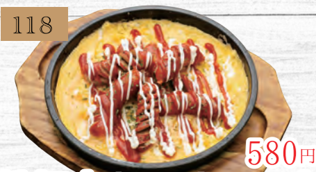
118 鉄板赤ウインナーエッグ 580円