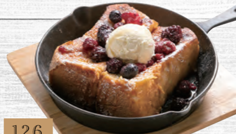
126 ⑧カフェ特製フレンチトースト 780円