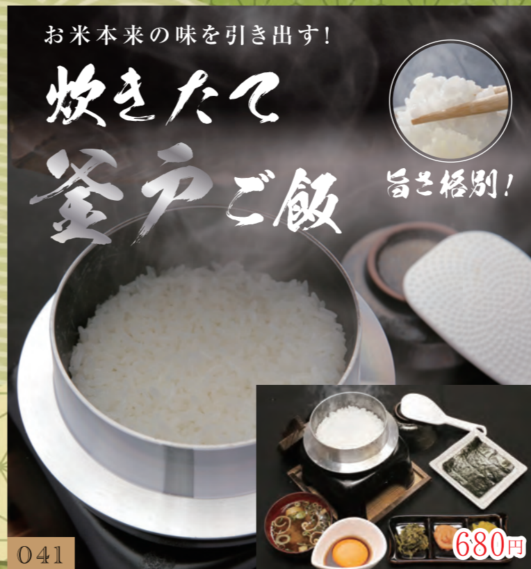
炊きたて 釜戸ご飯 旨さ格別！ 041 680円