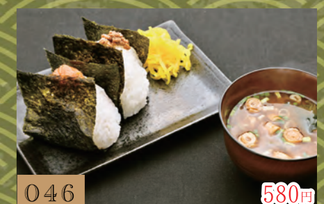
046 580円 おにぎりセット(赤だし付) (明太子・ピリ辛そばろ)