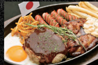
073 【単品】1,280円 074 【定食】1,580円 MIXグリル(チキンステーキ&ハンバーグ)