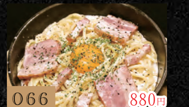
066 厚切りベーコンの濃厚カルボナーラ 880円