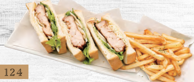
124 炙り焼きチキングリルサンド 880円