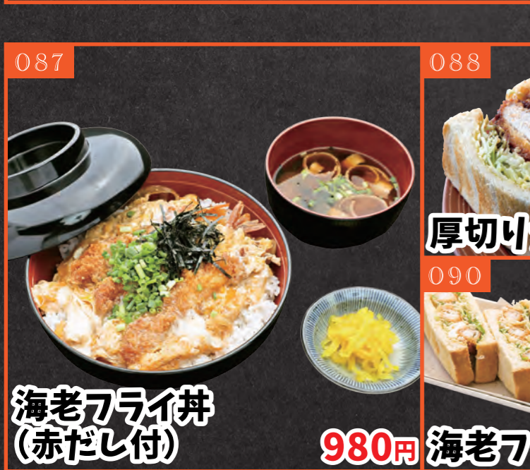
087 海老フライ丼 (赤だし付) 980円