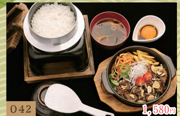
042 1,580円 特製牛ヒレステーキの釜戸ご飯定食