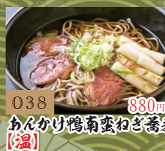
038 880円 あんかけ鴨南蛮ねぎ蕎麦【温】