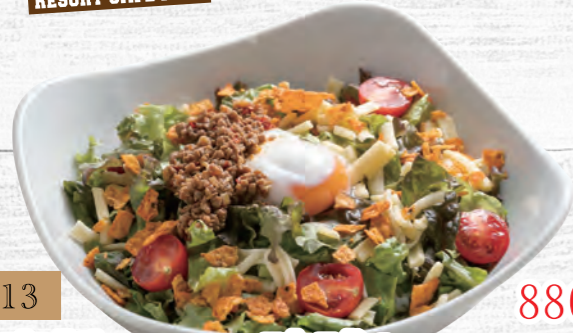
113 自家製ミンチの琉球タコライス 880円