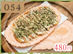
054 480円 屋台の大判たません