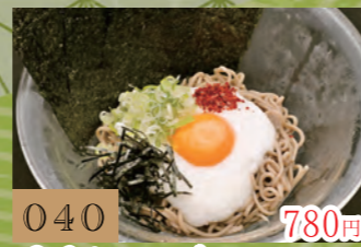
040 780円 月見とろろ冷やし ぶっかけ蕎麦【冷】