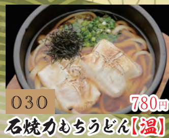
030 780円 石焼力もちうどん【温】