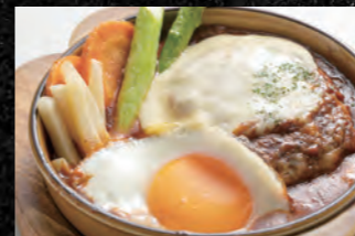
075 【単品】980円 076 【定食】1,280円 煮込みデミ玉チーズハンバーグ