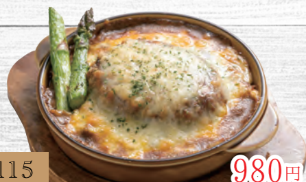
115 ⑧CAFE 焼きチーズバークカレードリア 980円