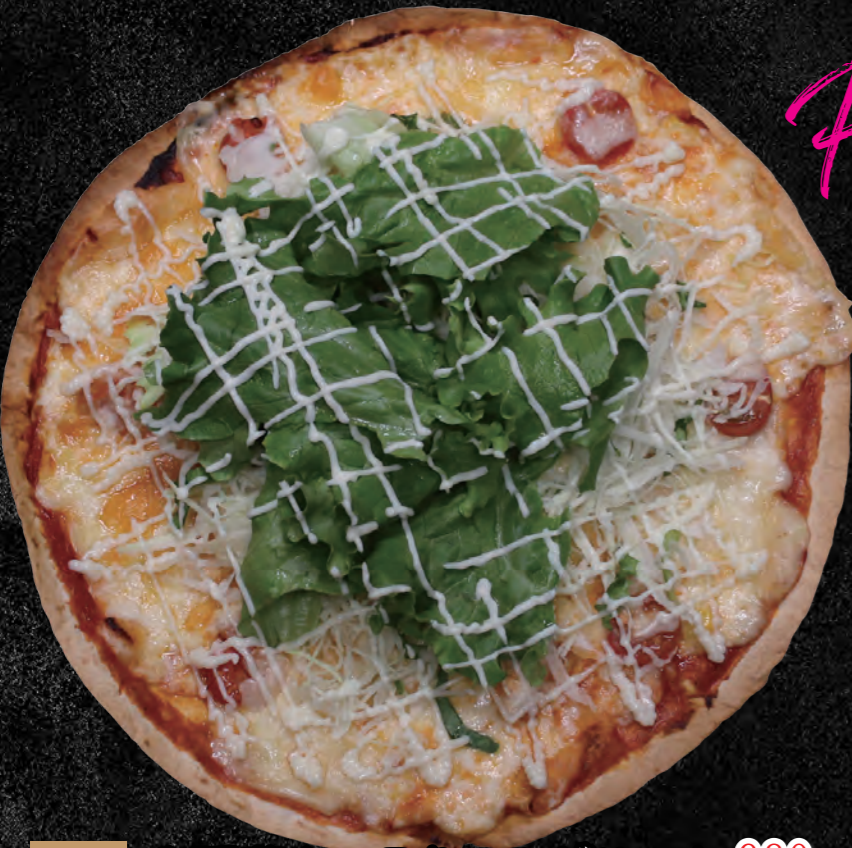
055 生野菜たっぷりマルゲリータ 980円