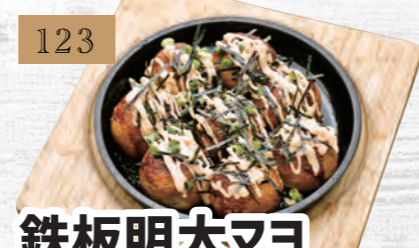
123 鉄板明太マヨソースたこ焼き 680円