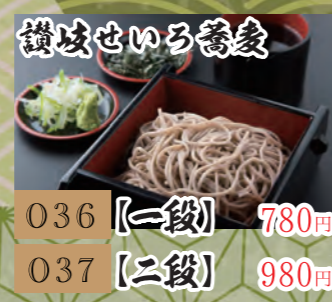
036 【一段】780円 037 【二段】980円